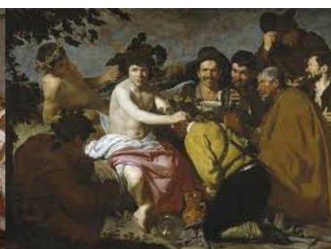
Triunfo de Baco